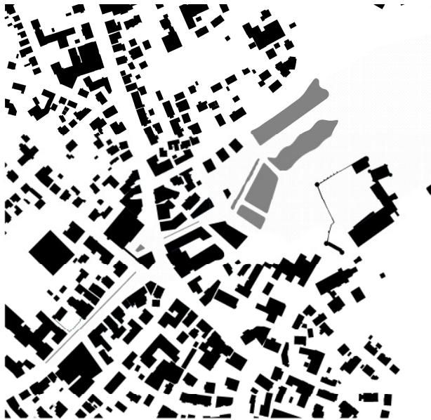
Städtebaulicher Strukturplan Jahr 2016 M 1 : 2000